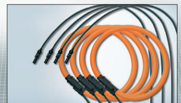
4 flexible Stromwandler 1000 A AC