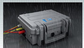
PQA820 im robusten Koffer (IP65)